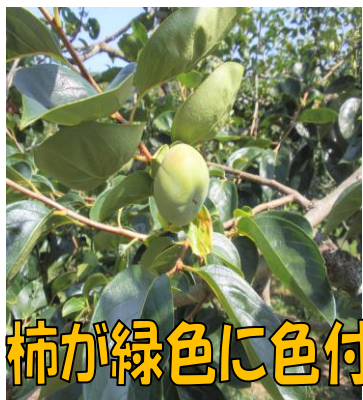
柿が緑色に色付いてきました(*^^)v